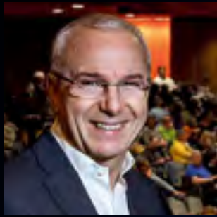
Jean Leonetti Maire d'Antibes Juan-les-Pins Président de la Communauté d'Agglomération Sophia Antipolis