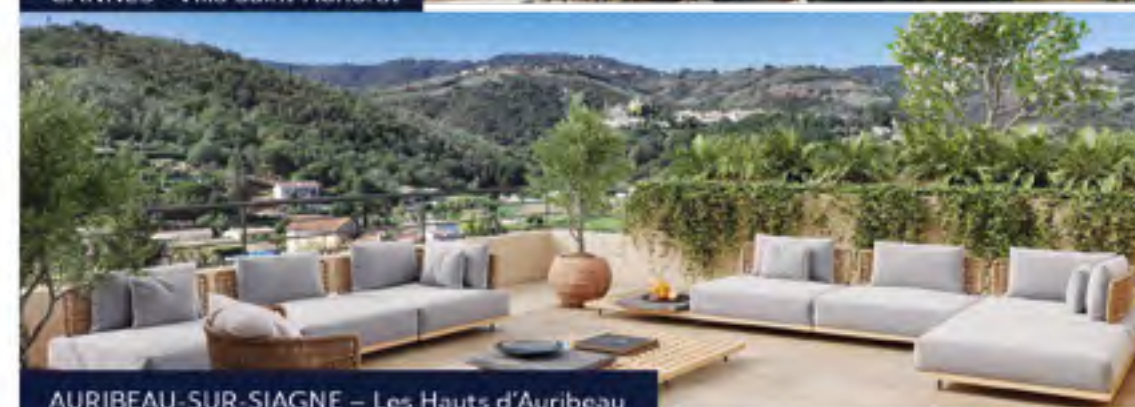
AURIBEAU-SUR-SIAGNE – Les Hauts d'Auribeau