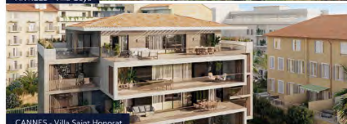
CANNES - Villa Saint Honorat