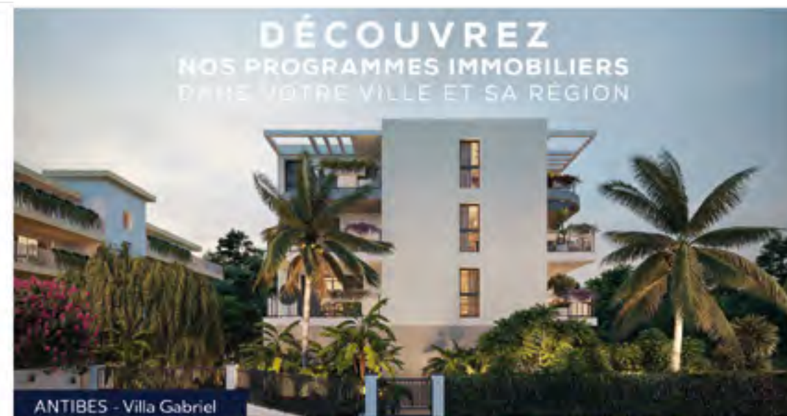
ANTIBES - Villa Gabriel