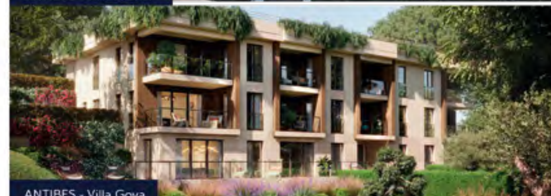
ANTIBES - Villa Goya