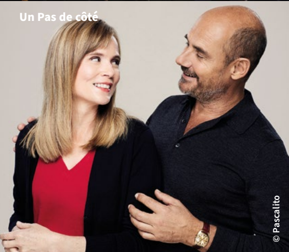
Un Pas de côté