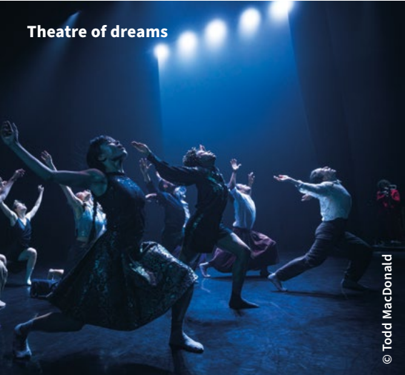
Theatre of dreams