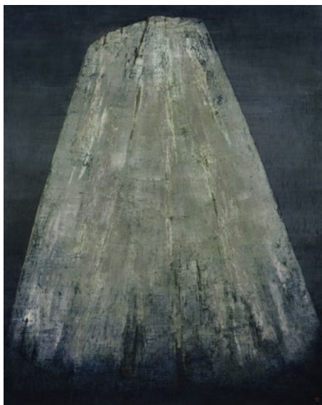
Anna-Eva Bergman, N°44-1980 , 1980, acrylique et feuille de métal sur papier marouflé sur panneau de bois, 10,8 x 13,8 cm