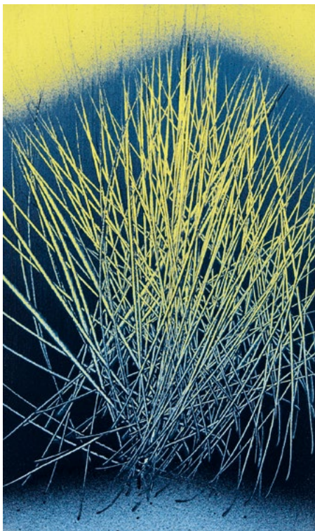
Hans Hartung, T1962-A10 , 1962, vinylique sur toile, 55 x 33 cm